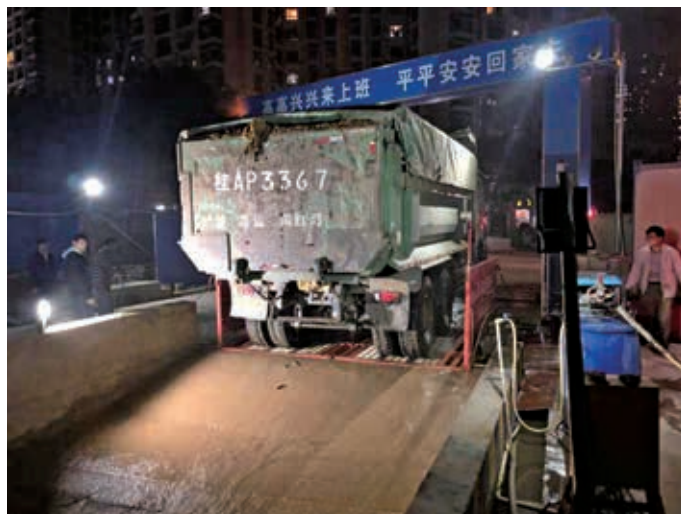
绿港·阳光里项目土方夜间施工

11月19日，南宁空港科技产业园项目首批楼栋1#、3#楼以及食堂主体工程顺利封顶。日前，工人们趁着大好天气紧锣密鼓地进行项目砌体工程及楼面的钢筋绑扎、模板安装建设，现场如火如荼，一派繁忙景象。该项目是市委市政府在空港经济区的重点项目，也是经开区管委会在空港经济区打造的第一个标准厂房项目。作为绿港集团2018年度重点项目，自今年8月12日正式开工以来，嘉通公司高度重视，精心组织，周密筹划，坚持“开局就是决战，起步就是冲刺！”的工作态度，成立了项目“党员先锋队”和“青年突击队”，充分发挥党组织引领作用。短短不到百日的时间内，项目就取得了部分主体工程封顶的阶段性成果，朝着整体项目