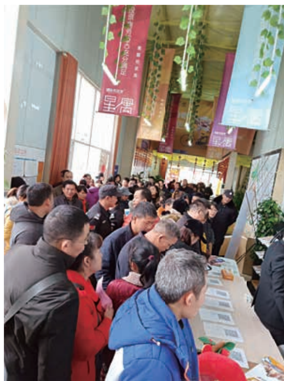
绿港·阳光里营销中心现场

绿港·阳光里项目整体占地136亩，位于空港商圈核心地段，毗邻机场地铁口，集商业街区、写字楼、酒