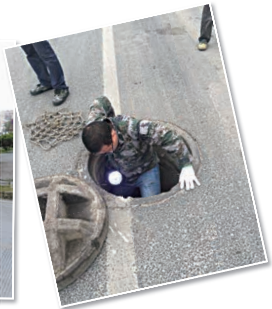
下井排查雨水管道

分工，团结一致，上下拧成一股绳，敢拼敢干敢啃硬骨头，坚决落实市委市政府和经开区的决策部署，形成全面战斗力。