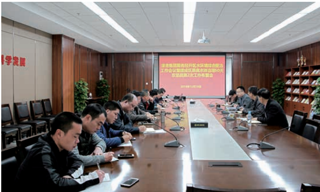
绿港集团研究部署黑臭水体整治工作

为坚决打好打赢黑臭水体治理60天攻坚战，确保全面完成经开区黑臭河道整治任务，绿港集团以问题为导向，加强统筹，综合施策，强势攻坚，深入开展黑臭水体整治工作。