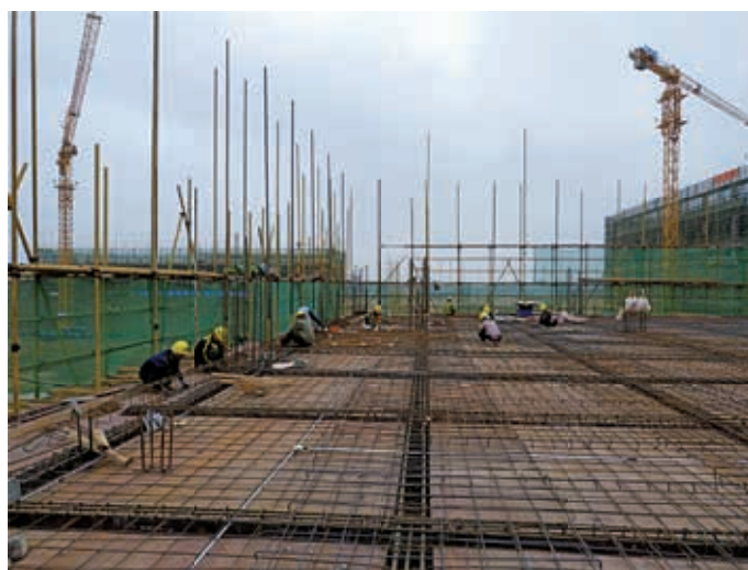
南宁空港科技产业园项目施工现场