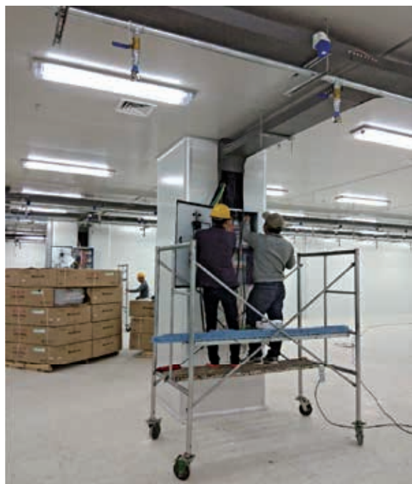
瑞声项目（一期）装修施工现场

为打好瑞声项目装修工程（一期）收官战，荣鑫公司上下一心，各相关部门加大项目建设及保证力度，通过公开招标竞争，选择负责过此类项目的资质较好的施工单位进行专业分包。在开标前，荣鑫公司还组织相关专家人员对竞标单位已完工项目进行实地考察，同时积极与项目业主和设计单位保持密切联系，多次邀请设计单位到项目现场进行实地沟通。虽然设计方案不断修改，施工过程中存在反复，但荣鑫公司的攻坚队员们通过