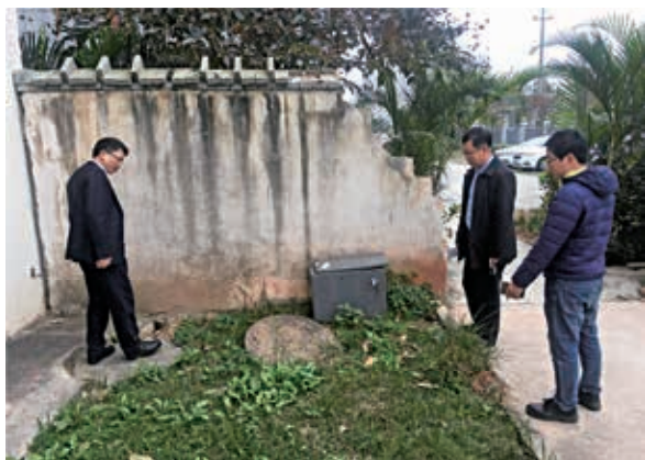
万方公司安全小组进行安全大检查

强调，安全生产与管理，是物业公司主要职责之一，要求公司上下要紧绷“生命安全大于天”意识，元旦期间要注意安全防范，狠抓安全管理，排查安全隐患。尤其近期天气寒冷，要彻底排查并提醒各业主安全用电，预防因电热炉、电热毯的使用导致的火灾及煤气中毒、烧炭中毒等恶性安全事件的发生。