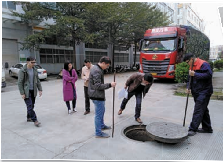
各部门联动深入园区进行黑臭水体排查