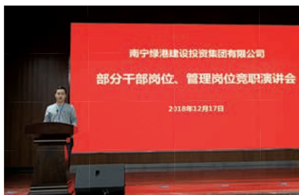
竞聘人员精彩发言

选人用人的机制中引入竞争机制，努力建设一支高素质干部队伍的重要举措，为优秀人才提供更多脱颖而出的机会和施展才华的舞台，推动形成能者上、庸者下、劣者汰的用人导向和环境，激发全体干部职工工作的积极性和创造性，促进绿港集团不断做专